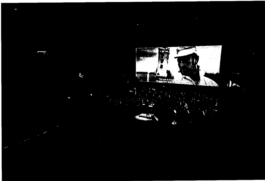
DOX:DANMARK åbning, februar 2023 Live-premierevisning af 'Os der lever' i Musikkens Hus i Aalborg med symfoniorkester m.m.

Til 2024 ønsker vi at få Svendborg kommune med om bord til at få dokumentarfilm ud til flere borgere.